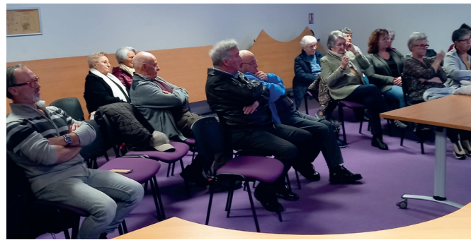
Une partie de l'assistance lors de l'assemblée générale de l'Amicale