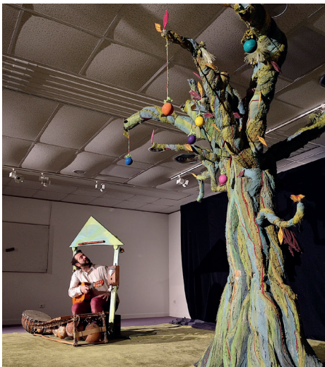
Les nuits de la lecture en image

Séances à 9h30 et 10h30, sur réservation.